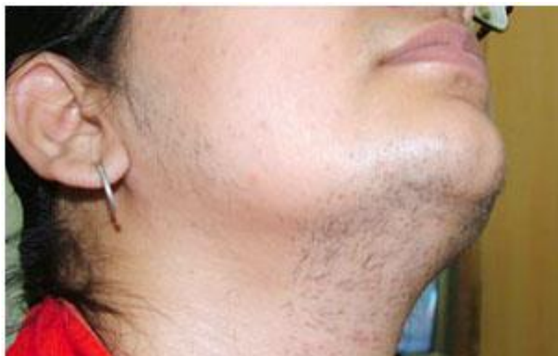
شکل ۲: رشد موهای زائد در ناحیه بالای لب فوقانی، چانه و اطراف صورت