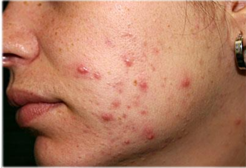
شکل ۳: جوشهای چرکی و آکنه