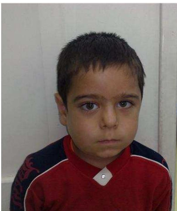
شکل ۱. بیمار با شکایت ضایعه‌ی بدون درد منفرد استخوان فک تحتانی سمت چپ مراجعه نمود.

ساعتی متر با گسترش به سمت ناحیه‌ی خلفی - تحتانی استخوان فک تحتانی مشاهده و لمس شد. در معاینه‌ی برآمدگی (توده) از طرف داخل دهانی مورد خاصی مشاهده نشد. در ناحیه‌ی تحت فکی، لنفادنوپاتی وجود نداشت. یافته‌های حاصل از معاینه‌ی فیزیکی احتمال کیست پریدنتال و یا استئومیلیت مزمن را مطرح کرد.